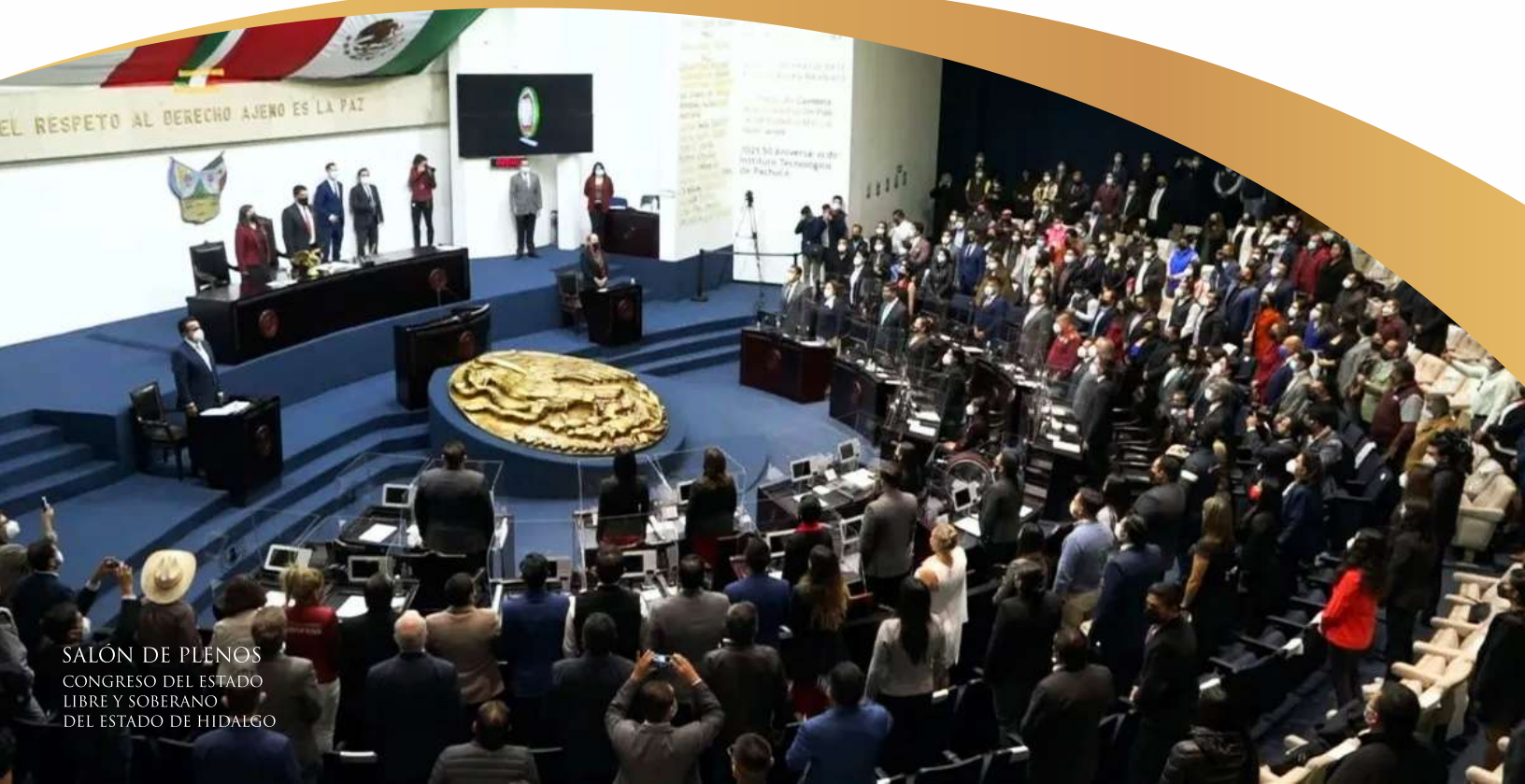
SALÓN DE PLENOS CONGRESO DEL ESTADO LIBRE Y SOBERANO DEL ESTADO DE HIDALGO