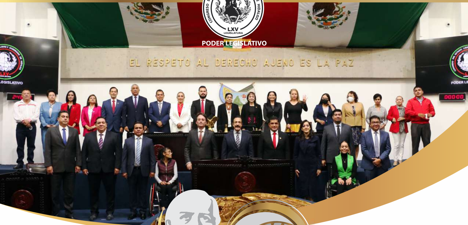
OMAR FAYAD MENESES GOBERNADOR CONSTITUCIONAL DEL ESTADO DE HIDALGO